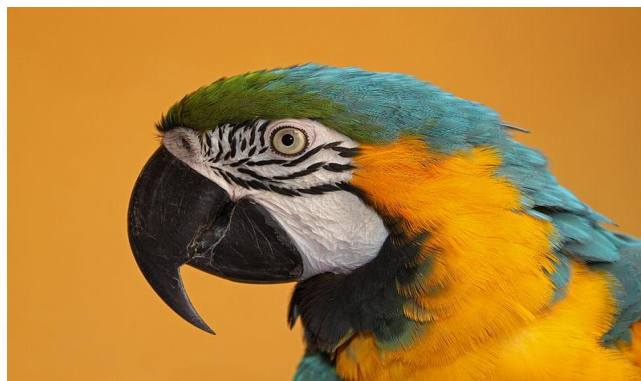
Imagen 1:

Wikimedia Commons es el repositorio de archivos libres y actualmente cuenta con más de 67.000.000 de fotografías, mapas, dibujos, audios o vídeos (Wikimedia Commons Contributors, 2020). Todos estos contenidos no solo se pueden usar para hacer más visual Wikipedia, sino que se pueden usar en cualquier lugar, como presentaciones, libros, artículos o posters, siempre y cuando se respete la licencia correspondiente. Para colaborar, basta con subir y liberar contenido de propia autoría , conseguir la autorización por parte de la institución o persona que detente los derechos del archivo que se desea subir, cargar material que ya ha sido publicado con una licencia libre aceptada por Wikimedia Commons o que ya se encuentra en el dominio público, es decir, que los derechos de autoría ya han expirado. En la Imagen 1 se presenta una fotografía de un guacamayo azuliamarillo considerada de calidad por la comunidad de Wikimedia Commons. Dentro de esta categoría en el proyecto se pueden encontrar fotografías vídeos e ilustraciones de guacamayos.