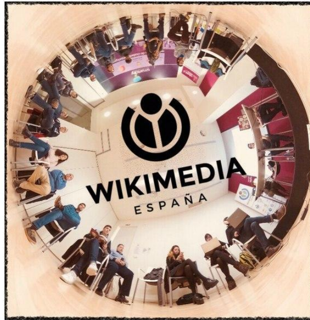
Imagen 3: Reunión de socios de Wikimedia España y logo del capítulo. Minúsculo, CC BY-SA 4.0, via Wikimedia Commons https://commons.wikimedia.org/wiki/File:Reuni%C3%B3n_Wikimedia_Espa%C3%B1a_Marzo_2018_360.tif

Como se ha visto a lo largo de este módulo, el movimiento Wikimedia es más que Wikipedia y lo constituyen millones de personas alrededor del planeta. Todo el mundo tiene cabida en él, sea cual sea el área de conocimiento en el que se quiera colaborar, la lengua que se use o la procedencia geográfica.