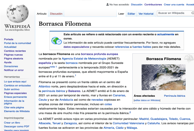
Figura 2: Ejemplo de artículo con una plantilla de aviso sobre “Evento reciente o actualmente en curso”. Ejemplo en el artículo Borrasca Filomena , tomado en la semana en que la borrasca todavía estaba en curso. Fuente: https://es.wikipedia.org/w/index.php?title=Borrasca_Filomena&oldid=132479781

En ocasiones, quienes editan pueden crear artículos relacionados con un evento reciente o actualmente en curso, el cual puede sufrir cambios en las horas siguientes debido a que la información se va generando minuto a minuto en los medios de comunicación. El hecho de editar artículos sin disponer de la suficiente perspectiva histórica se denomina recentismo , que puede generar una sobrecarga de información, en ocasiones con fundamentos débiles, sobre unos hechos que podrían no ser claros o poco relevantes puestos en contexto (Wikipedia Contributors, 2020c). Cuando se detecta un artículo relacionado con un acontecimiento reciente, se le coloca una plantilla especial, al comienzo del mismo, como se muestra en la Figura 2.