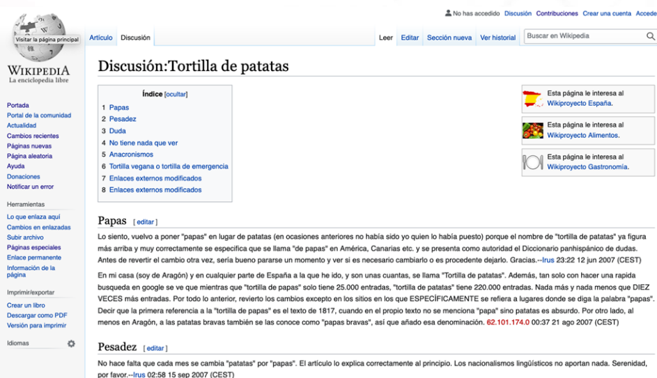
Figura 1: Página de discusión del artículo Tortilla de patatas, donde se aprecia cómo la comunidad llega a un acuerdo sobre la denominación "papas" o "patatas".

Las personas que editan Wikipedia, denominadas wikipedistas, para comunicarse con otros editores o editoras utilizan las páginas de discusión personales donde se pueden dejar mensajes y recomendaciones. De hecho, todas las páginas de Wikipedia cuentan con su propia página de discusión como se observa en la Figura 1. En las de los artículos se puede llegar a acuerdos para la mejora del contenido en cuestión. También existen espacios con normativas , páginas de ayuda y lugares donde se comentan y se exponen nuevas iniciativas y otras ideas (espacio que se denomina Café ).