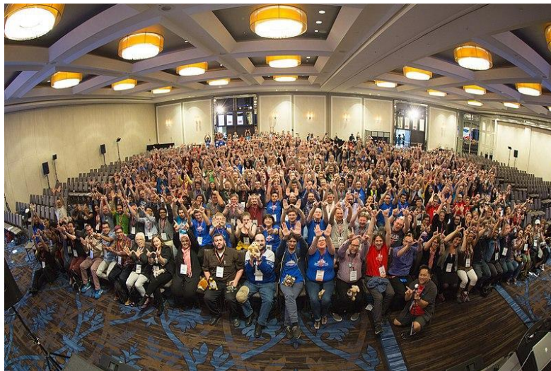
Imagen 2: Encuentro internacional de wikipedistas, Wikimania 2017.